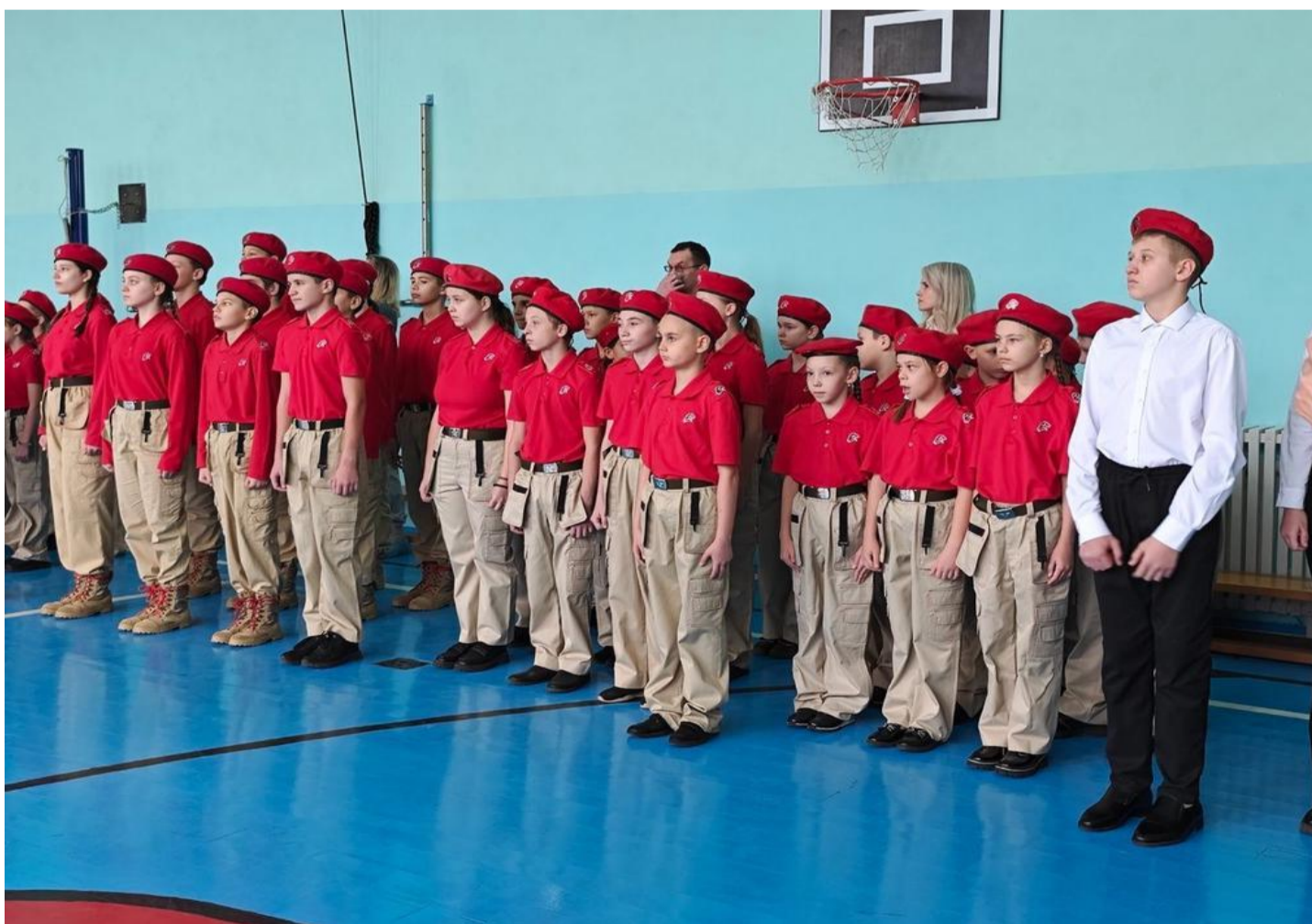
Церемония посвящения в ряды «Юнармии»

Юнармейский отряд школы №18 принял активное участие. Каждому юнармейцу в этот день выпала честь принести торжественную клятву.